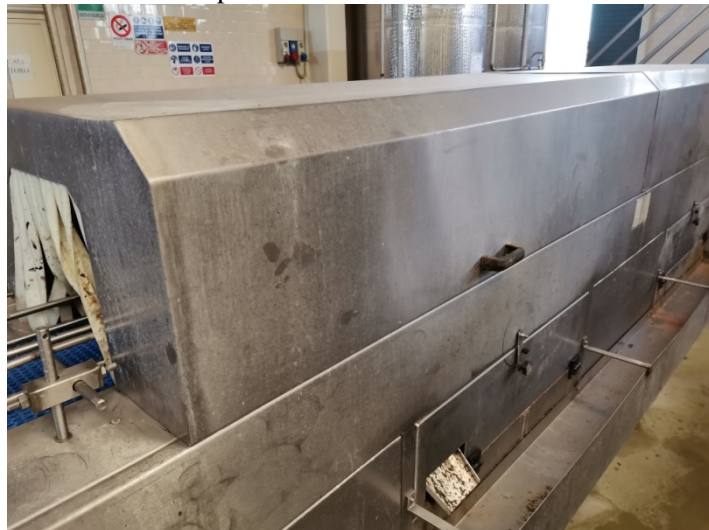
Lavatrice per Lattine e vasi COREMI