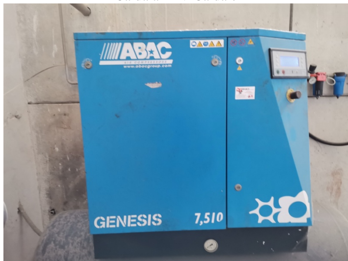
Compressore ABAC Genesis