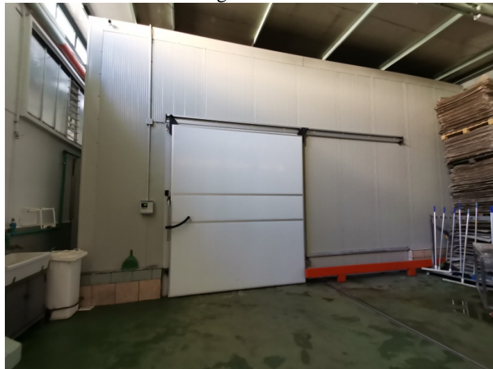
Cella frigorifero MasterCella