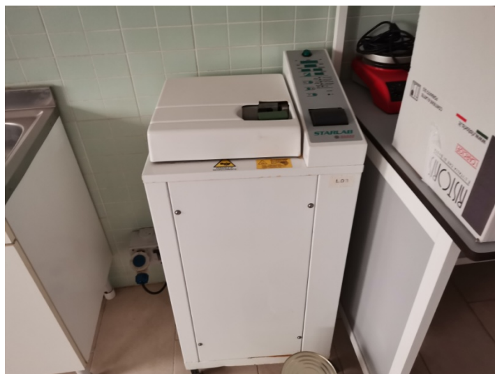
Autoclave stralab Liarre