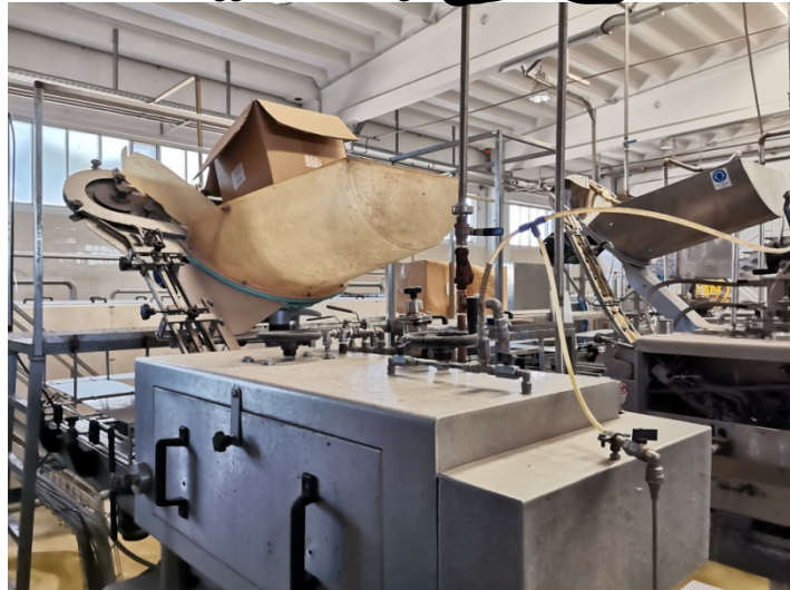
Capsulatrici STV e GHERRI