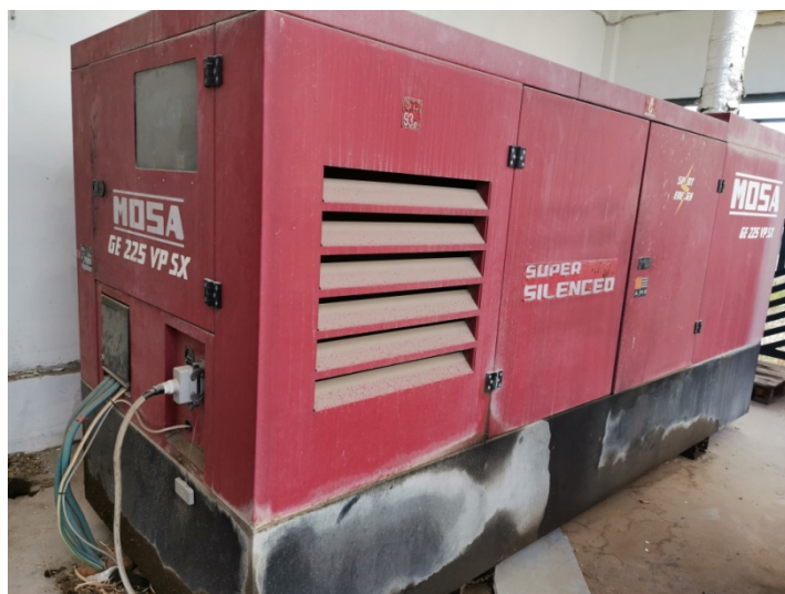
Gruppo elettrogeno MOSA