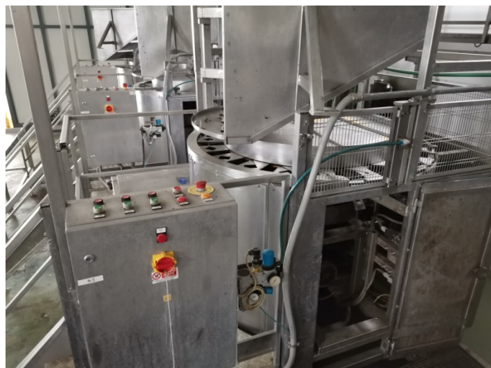
Taglierine carciofi mod. TF