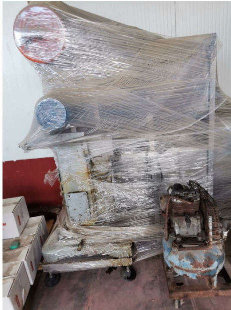
Graffatrice non funzionante