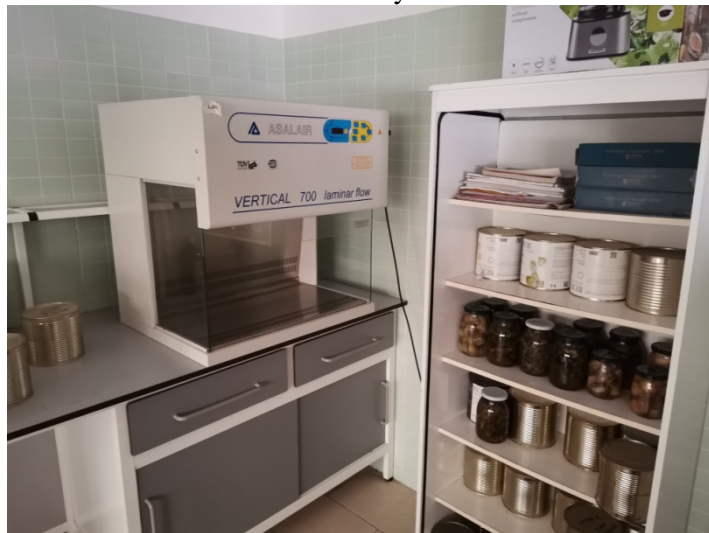
Analizzatore Asalair Vertical