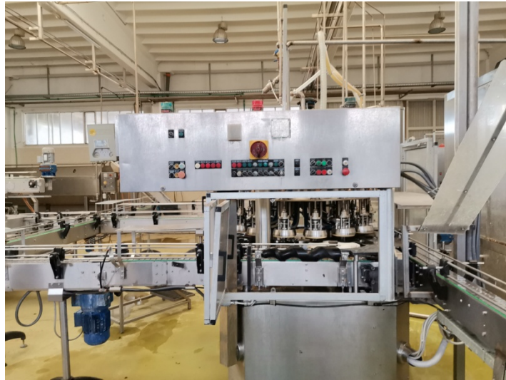
Col matrice STV con serbatoio