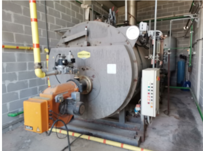
Caldaia Magazzini Parma