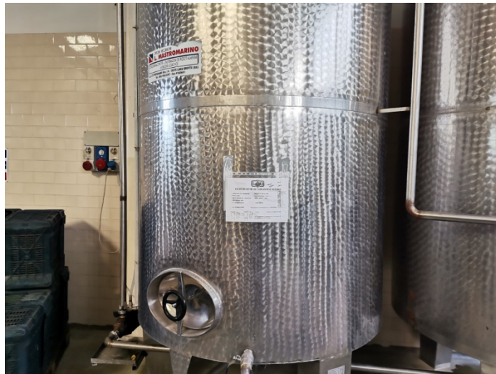
Serbatoi 50 ql.