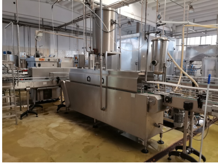
Riempitrice BA GOM