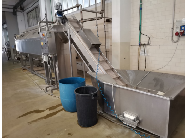
Cuocitore compreso di vasca