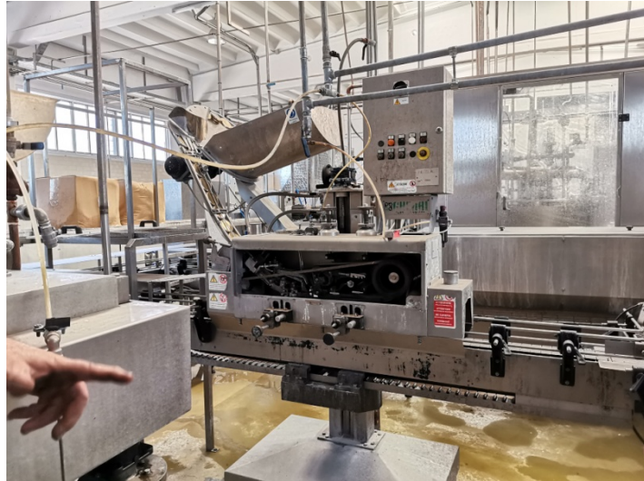
Aggraffatrice Kg. 1 [REDACTED]