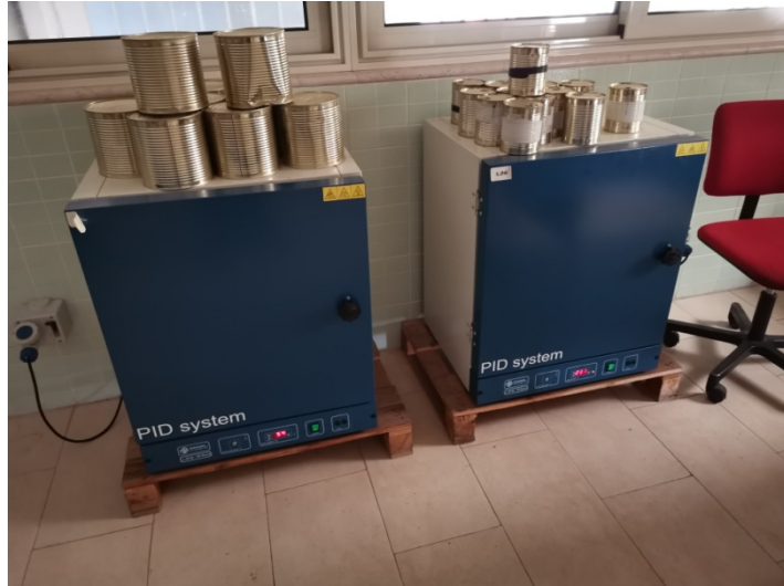
Stufe PID System