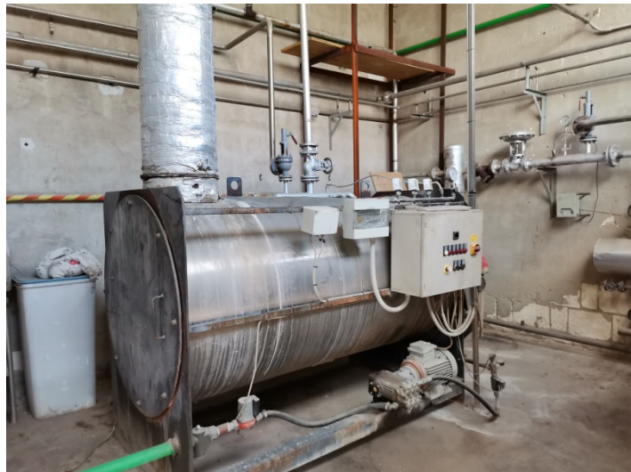
Caldaia LPV Caldaie