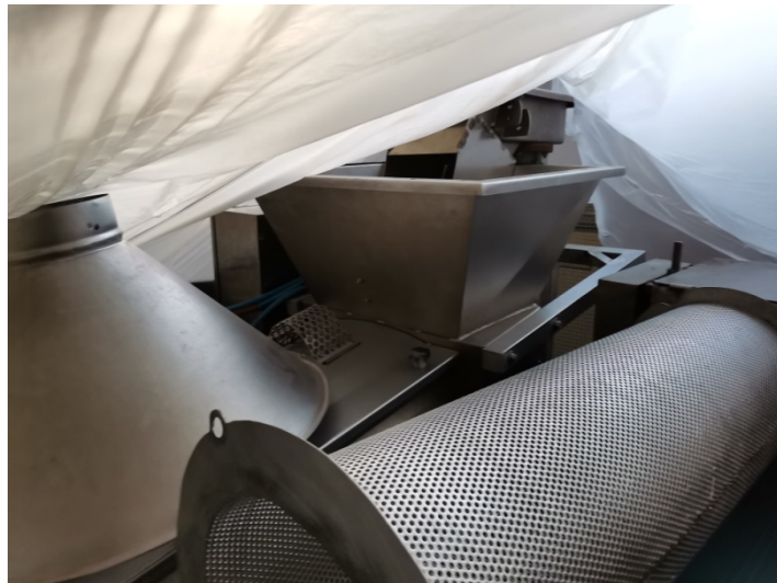
Passatrice tipo ANS