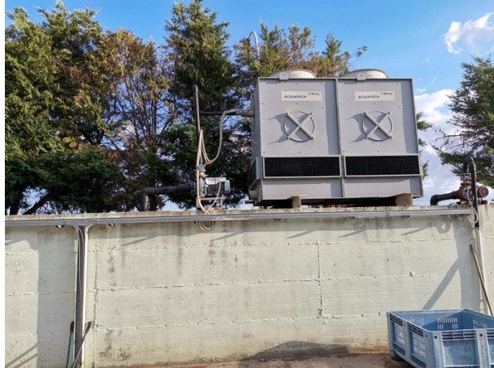
Terre di raffreddamento acquatech Marley Italia