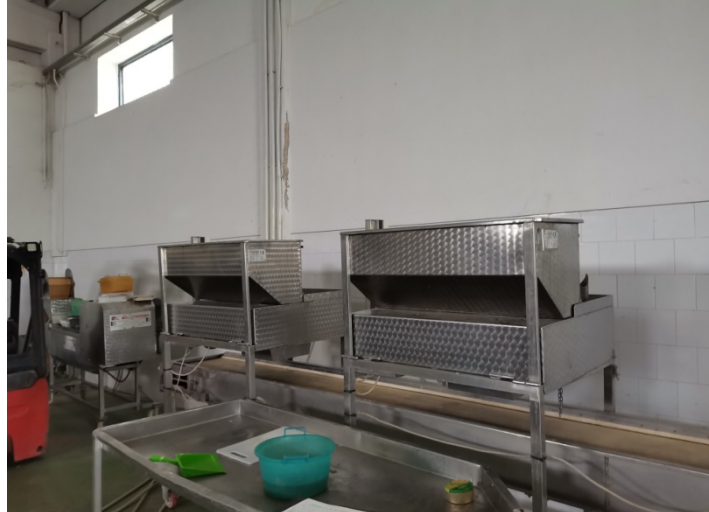
Taglierine carciofi a spicchi